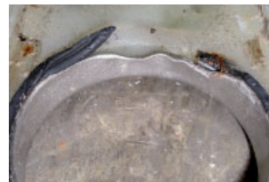
Verschleiß durch Rotation