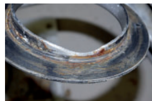
Verschleiß des Bordrings