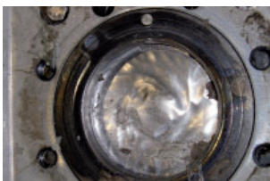
Verschleiß der Schieberplatte