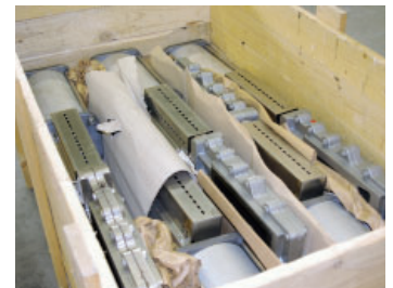
neuwertiger reparierter Schieber