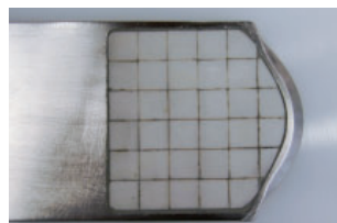
Minimierung des Verschleißes durch Keramikfeld