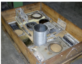
Demontage und Befundbericht